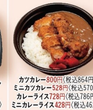
カツカレー800円〈税込864円〉 ミニカツカレー528円〈税込570円〉 カレーライス728円〈税込786円〉 ミニカレーライス428円〈税込462円〉