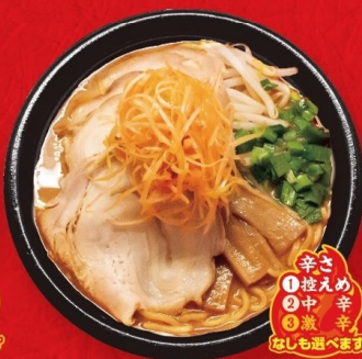
みそネギチャーシュー ラーメン(赤みそ・白みそ) 1,091円 〈税込1,178円〉