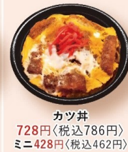
カツ丼 728円 〈税込786円〉 ミニ428円〈税込462円〉