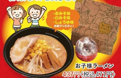
お子様ラーメン 437円 〈税込471円〉