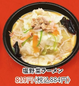
塩野菜ラーメン 819円 〈税込884円〉