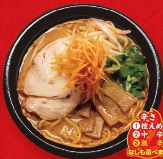
みそネギラーメン (赤みそ・白みそ) 837円 〈税込903円〉