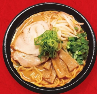
みそラーメン (赤みそ・白みそ) 764円 〈税込825円〉