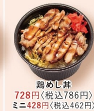
鶏めし丼 728円 〈税込786円〉 ミニ428円〈税込462円〉