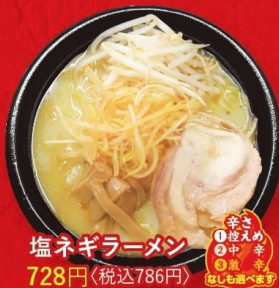
塩ネギラーメン 728円 〈税込786円〉