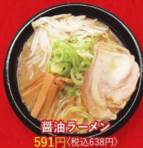
醤油ラーメン 591円 〈税込638円〉