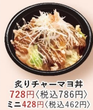
炙りチャーマヨ丼 728円 〈税込786円〉 ミニ428円〈税込462円〉

御飯物 お米は宮城県産を使用。2種類のサイズからお選び頂けます。 ライス 219円 〈税込236円〉 半ライス 119円 〈税込128円〉