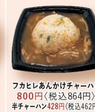
フカヒレあんかけチャーハン 800円 〈税込864円〉 半チャーハン428円〈税込462円〉